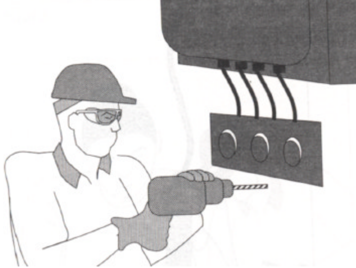
Fig.2.- Taladradora con pulsador de bloqueo.