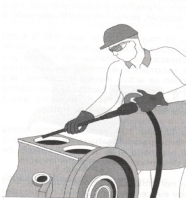
Fig. 1.- Empleo del martillo neumático con cabeza de cincel Para cincelar piezas de cincelar. Obsérvese el control de la mano y el pulgar y el uso de gafas protectoras.