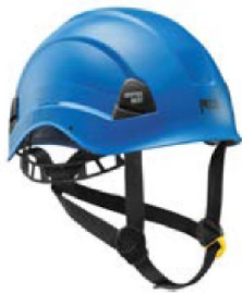
Figura 3. Casco con barbiquejo EN 397