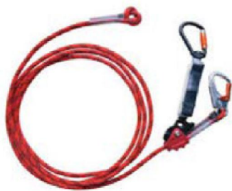
Figura 5. Dispositivos anticaídas deslizantes sobre línea de anclaje flexible (cuerda) EN 353-2