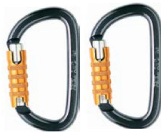
Figura 4. Conectores EN 362