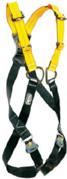
Figura 1. Arnés anticaídas EN 361