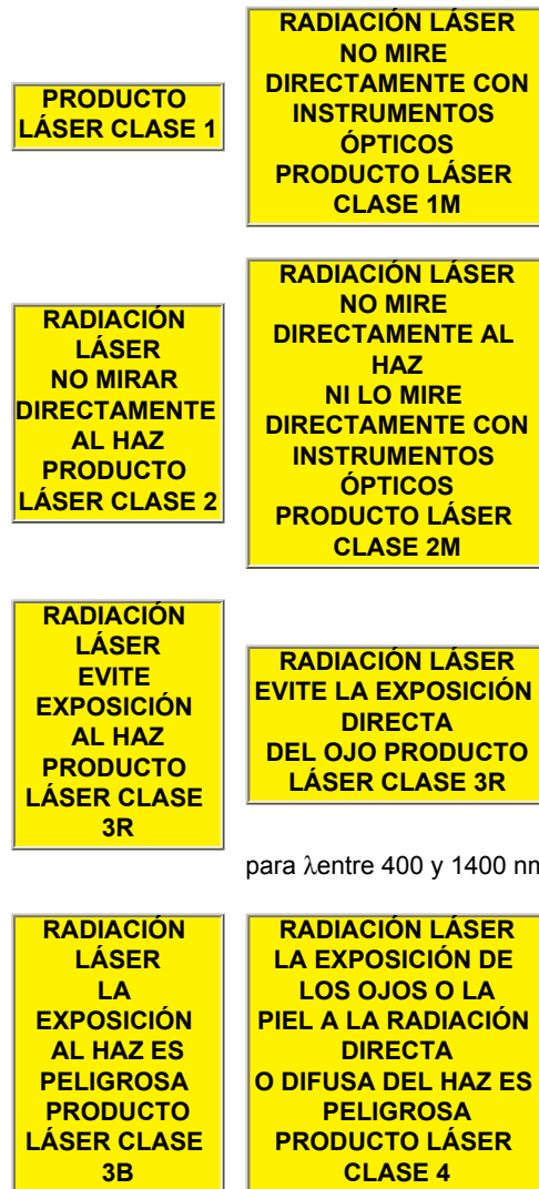
Figura 3 Etiquetas explicativas

La norma permite elegir entre las dos frases de advertencia de la figura 4.