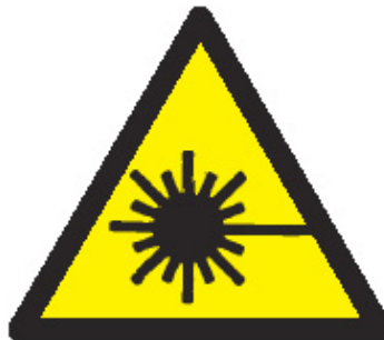
Figura 2 Etiqueta de advertencia

Además de la información contenida en las etiquetas explicativas descrita en la figura 3, los productos láser, con excepción de los de la Clase 1, deben contener cierta información relativa a las características técnicas, como la potencia máxima de la radiación emitida, la duración del pulso (si ha lugar) y las longitudes de onda emitidas, así como el nombre y la fecha de publicación de la norma en la que se basa la clasificación del producto. Para los láseres de Clase 1 y 1 M esta información tiene que estar contenida en el manual de información del usuario, en lugar de suministrarla en las correspondientes etiquetas adheridas al producto.